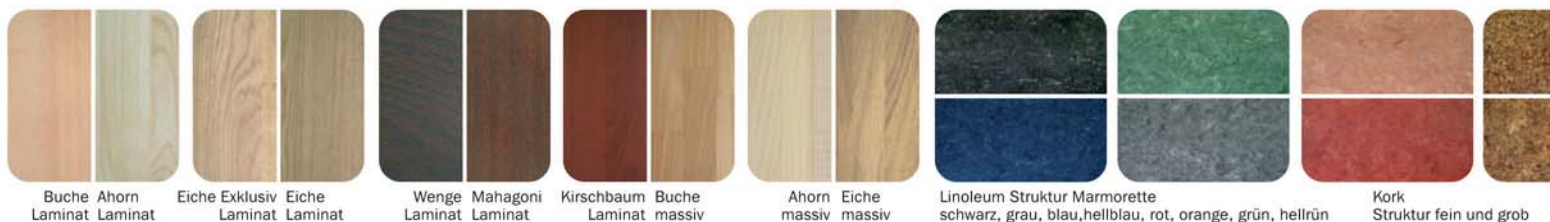
Buche Ahorn Laminat Laminat

aus Massivholz, Laminat, Linoleum, Kork in vielen Farben und Ausführungen